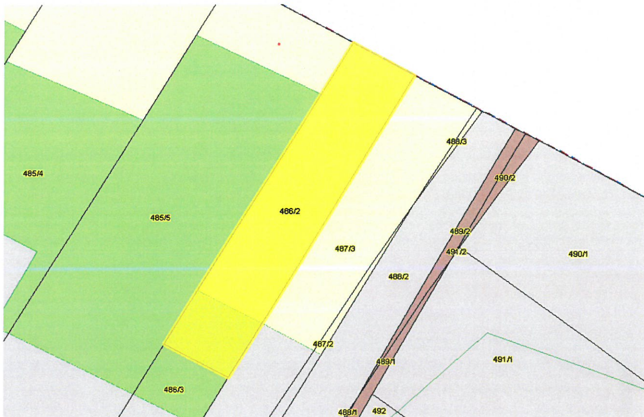
Załącznik Nr 1 do Uchwały Nr ...../...../2024 Rady Miejskiej we Włodowicach z dnia .....2024 roku