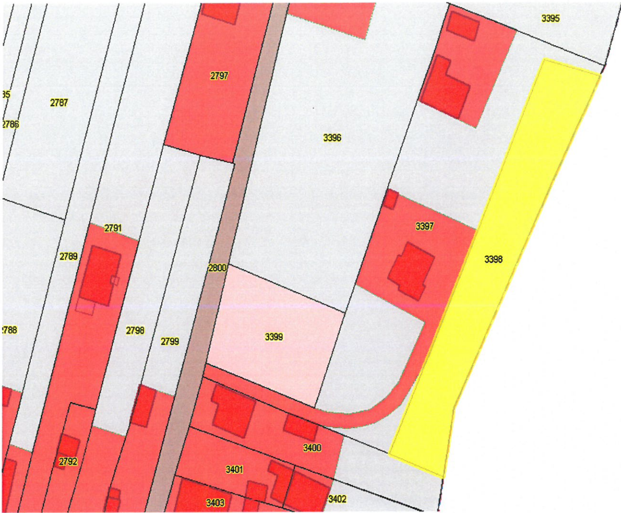
Załącznik Nr 3 do Uchwały Nr ...../...../2024 Rady Miejskiej we Włodowicach z dnia .....2024 roku