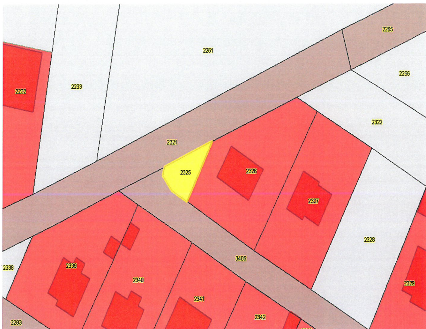
Załącznik Nr 4 do Uchwały Nr ...../...../2024 Rady Miejskiej we Włodowicach z dnia .....2024 roku