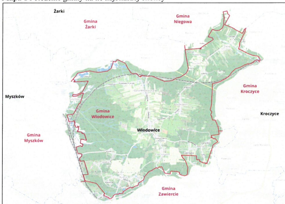
Mapa 1 Położenie gminy na tle najbliższej okolicy